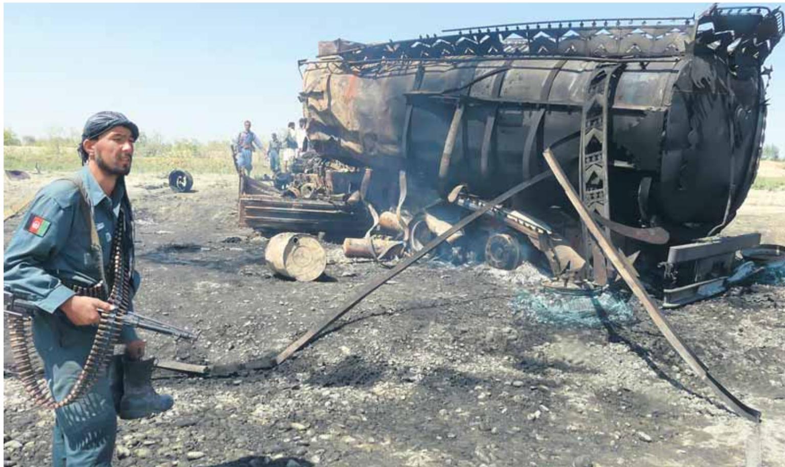
▶ ЗАТЕЮ АФГАНСКИХ «РОБИН ГУДОВ» ПРЕВРАЛА АМЕРИКАНСКАЯ АВИАЦИЯ. ИТОГ — СОТНИ ПОГИБШИХ МИРНЫХ ЖИТЕЛЕЙ