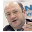
Александр Бабаков, заместитель председателя Госдумы:

— У «Справедливой России» есть свои приоритеты в законодательной работе на эту сессию. Хотя мы прекрасно понимаем, что ситуация в стране непростая и поэтому принципиально будем настаивать на рассмотрении тех законов, которые в первую очередь направлены на социальную защиту наших граждан. Среди них, конечно же, особое место занимает бюджет следующего года. Кроме того, рассмотрим отчет правительства России и Центрального банка, где будут непростые обсуждения, и как следствие этих обсуждений появятся соответствующие рекомендации на предстоящий период. Есть и вопросы, связанные с пенсионным законодательством, и, как ни странно, с инвестициями в экономику, с созданием благоприятных условий для развития малого и среднего бизнеса.