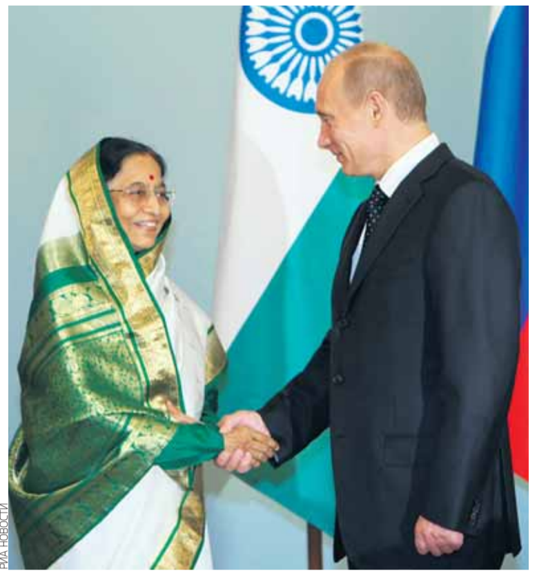
ВЛАДИМИРУ ПУТИНУ И ПРЕЗИДЕНТУ ИНДИИ ГОСПОЖЕ ПРАТИБХЕ ПАТИЛ ЕСТЬ ЧТО ОБСУДИТЬ

Именно жесткая позиция США и международные договоренности постоянно препятствовали налаживанию российско-индийского ядерного сотрудничества. Так, соглашение о строительстве АЭС в Куданкуламе должно было быть подписано еще в 1994 году, а заключено оно было лишь в конце 2001 года. При этом в марте 2006 года во время визита Джорджа Буша в Индию было подписано соглашение о мирном сотрудничестве в области атомной энергии, которое одобрил конгресс США. Согласно этому соглашению Индия будет получать ядерные технологии и топливо из США без подписания договора о нераспространении ядерно-