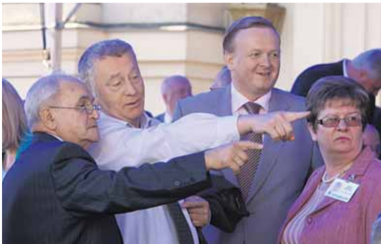
▶ РУКОВОДИТЕЛЬ ЛДПР ВЛАДИМИР ЖИРИНОВСКИЙ ЧУВСТВУЕТ СЕБЯ ВПОЛНЕ ПРИВЫЧНО В АТМОСФЕРЕ ПРАЗДНИКА

Кульминация торжеств — Международный военно-музыкальный фестиваль «Спасская башня». Военные оркестры и подразделения почетной охраны глав государств представляли 9 стран: Россию, Великобританию, Израиль, Индию, Италию, Казахстан, Китай, Финляндию и Францию. Разумеется, как и следовало из названия фестиваля, 1000 музыкантов и военнослужащих выстроились в парадных и не совсем привычных мундирах на Красной площади. Оркестр Республиканской гвардии Франции выступал совместно с оборотистой и почитаемой в России Мирей Матье. Неожиданные участники — монахи из школы боевых искусств монастыря Шаолинь. С военной точностью ровно в 8.00 вечера на главной площади страны грянули литавры. Впрочем, как и предполагалось с самого начала, исполнялись отнюдь не только браурные военные марши. Прозвуча-