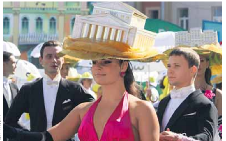
▶ РЕКОНСТРУКЦИЯ БОЛЬШОГО ТЕАТРА ЕЩЕ НЕ ЗАВЕРШЕНА, НО ЕГО ШЛЯПНАЯ КОНСТРУКЦИЯ ДЕМОНСТРИРУЕТСЯ ВСЕМ ЖЕЛАЮЩИМ

ли попури из битловских тем «Хей, Джуд», «Желтая подводная лодка», Мирей Матье вступила в программу, исполнив «Очи черные» по-русски, с весьма элегантным французским акцентом. Оркестр армии обороны Израиля начал с классического репертуара, а потом — зажигательная «Хава Нагила». Волинки, литавры, барабаны — виртуозное искусство игры на них завораживало. Праздник завершился под залпы фейерверка и бетховенскую «Оду к радости», которую хором исполняют все участники и им подпевают зрители. Впрочем, и это действо вполне традиционно и проводится не первый год.