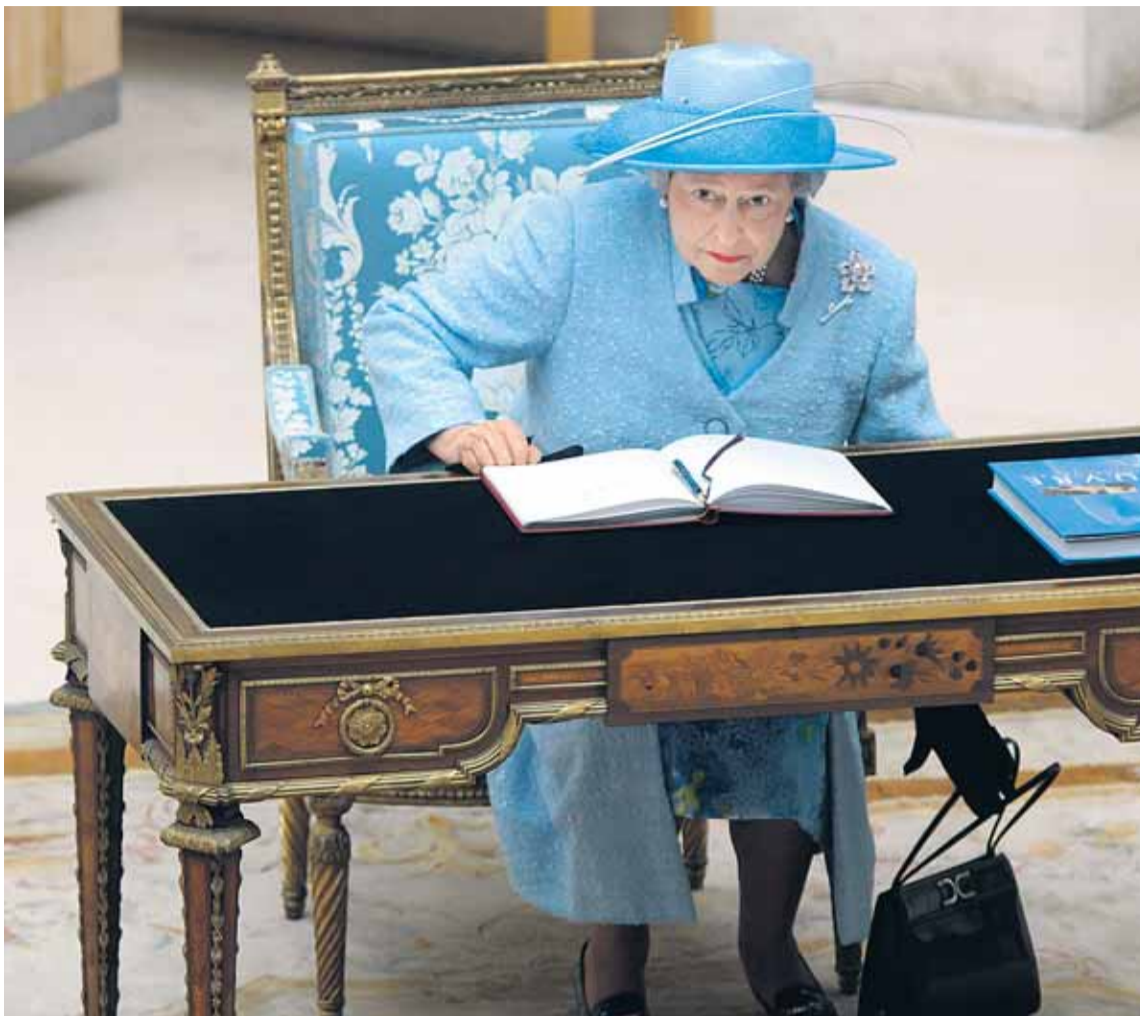
ИСПОВЕДЬ ЭКОНОМИСТОВ ЗАСТАВИЛА ЕЛИЗАВЕТУ ВТОРУЮ ПРОВЕРИТЬ, НА МЕСТЕ ЛИ ЕЕ КОШЕЛЕК

Понятное дело, что целью организации таких тендеров на проведение научно-исследовательских работ (НИР) совсем не является получение точных прогнозно-аналитических оценок. Там другие