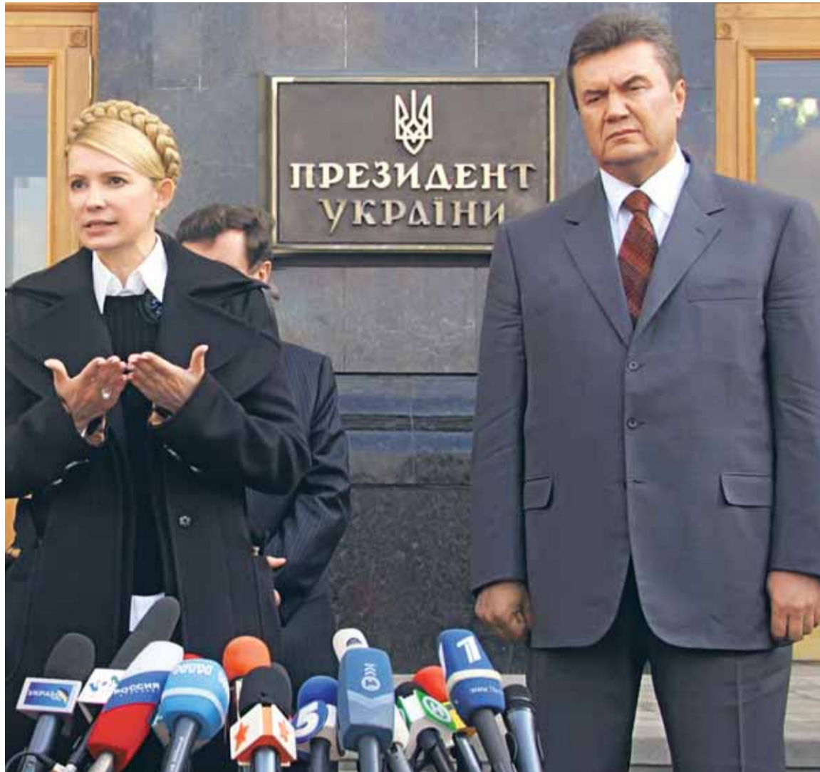
ЮЛИЯ ТИМОШЕНКО И ВИКТОР ЯНУКОВИЧ — СТАРЫЕ НЕПРИМИРИМЫЕ КОЛЛЕГИ ПО БОРЬБЕ ЗА ВЛАСТЬ

Лидеры предстоящей президентской гонки на Украине занимаются консолидацией своих электоратов