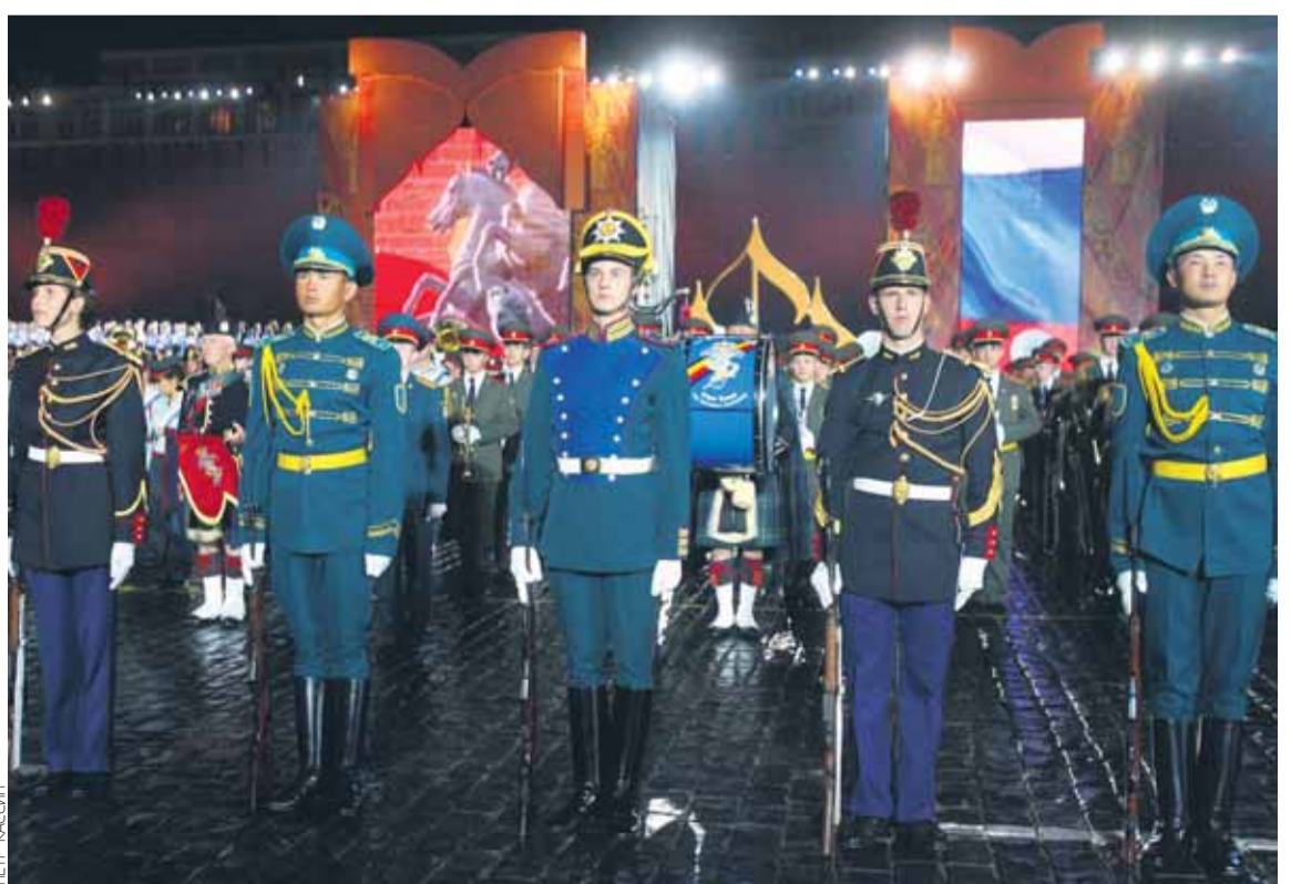
▶ ПРЕДСТАВИТЕЛИ РОТ ПОЧЕТНОГО КАРАУЛА ИЗ РАЗНЫХ СТРАН МИРА В ПАРАДНЫХ МУНДИРАХ

А так все почти так же. Праздник удался. До встречи ровно через год! ■