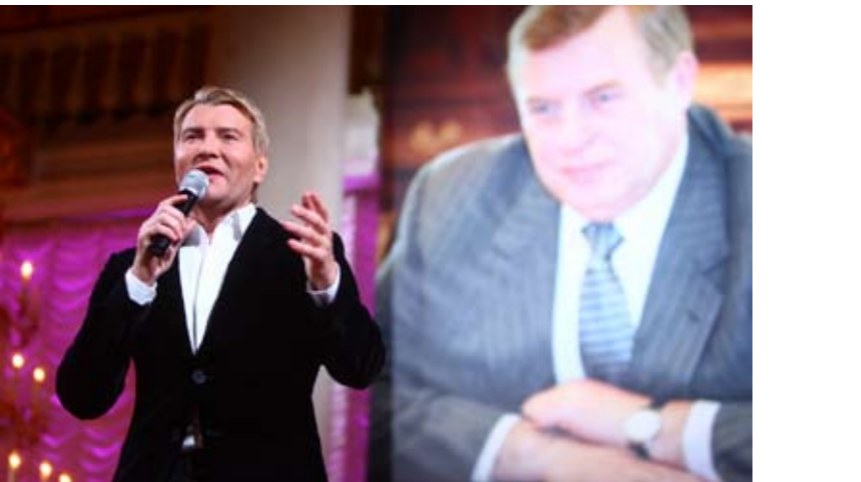
Николай Басков, Народный артист России, десятикратный обладатель премии «Золотой граммофон»

деле всей своей жизнью демонстрировал журналист и политик Геннадий Селезнев ».