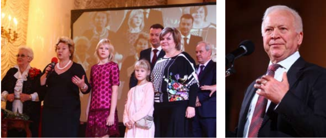
Семья Геннадия Николаевича Селезнева