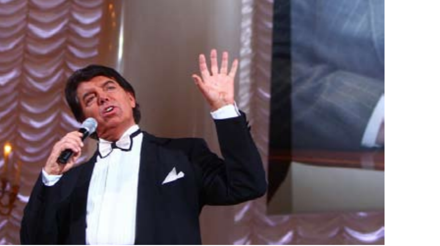
Сергей Захаров, Народный артист России

«Благодаря журналистскому прошлому Селезнев слыл, пожалуй, самым доступным спикером парламента и наиболее терпимым к критике его самого в СМИ. А будучи человеком левых убеждений, он умел выстраивать отношения с различными политическими группами и никогда не считал компромисс признаком поражения, — пишет «Независимая газета» в статье «Политиком его сделала журналистика». — По мнению многих, кто его знал, он был приверженцем скорее социал-демократической идеи. Во всяком случае основанная им в 2002 году Партия Возрождения России по своей программе отличалась повышенной социальностью целей и задач. А также тем демократизмом, который не на словах, а на