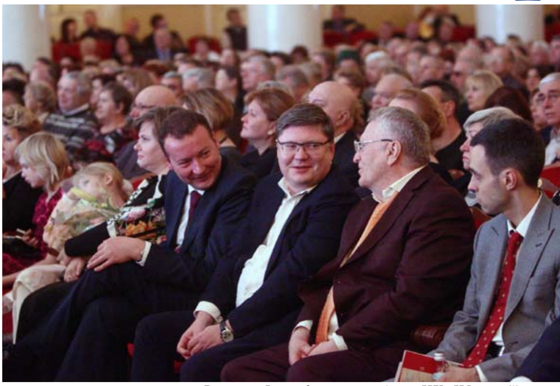
Почтил память Геннадия Селезнева и лидер фракции ЛДПР в ГД Владимир Жириновский

Апогеем юбилейных торжеств, безусловно, стал памятный вечер, состоявшийся 2 ноября в Колонном зале Дома союзов. Депутаты, политики, журналисты, друзья Геннадия Николаевича поделились своими воспоминаниями о нем, рассказали, чем он им запомнился. Артисты, с которыми дружил и кому помогал в творческом становлении Геннадий Селезнев, спели его любимые песни. Открыли его народная артистка России Анна Шатилова и председатель Центрального штаба общероссийского общественного движения «Россия», член