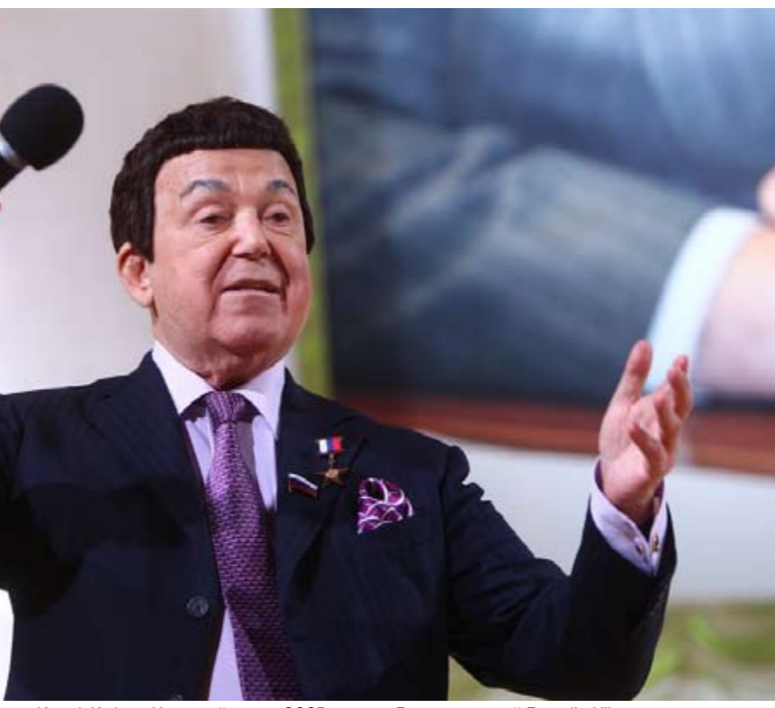
Иосиф Кобзон, Народный артист СССР, депутат Государственной Думы II—VII созывов

Геннадий Селезнев и Борис Токарев знакомы давно — последние лет 15. Совместно делали телекинофорум «Вместе», который проводился в Ялте. Девиз его — «Жить вместе — жить в мире». «Он был фантастическим другом и человеком», — так называется о Геннадии Селезеве Борис Токарев. А потому сделать кинокартину о жизни друга режиссер посчитал святым долгом. «Этот человек, — рассказывает Борис Васильевич, — за свою достаточно короткую жизнь очень многое успел сделать и создать. Он прошел путь от мальчишки из ПТУ до выдающегося журналиста. А потом был полити-