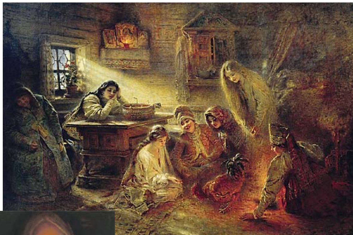
Константин Маковский. «Святочные гадания»

Январские дни, несмотря на их лютые морозы, умиротворяют и согревают души многих россиян не только новогодними праздниками, но и Святками. Они на Руси всегда были долгожданными, поэтому отмечались пышно, с размахом, сопровождалась многочисленными ярмарками, посиделками, молодежными гуляньями. Праздничные дни начинаются с сочельника (канун Рождества), то есть вечером 6 января, а завершаются в Крещение, которое отмечается 19 января. Святки обычно делились на три главных праздника – Рождество, старый Новый год и Крещение.