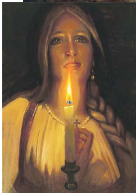
Константин Васильев «Гадание»