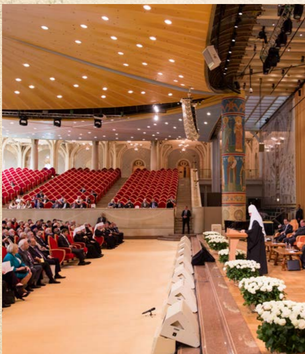
В Храме Христа Спасителя прошла IV отчётно-выборная Конференция Императорского Православного Палестинского Общества, приуроченная к 135-летию ИППО. Июнь 2017 г.