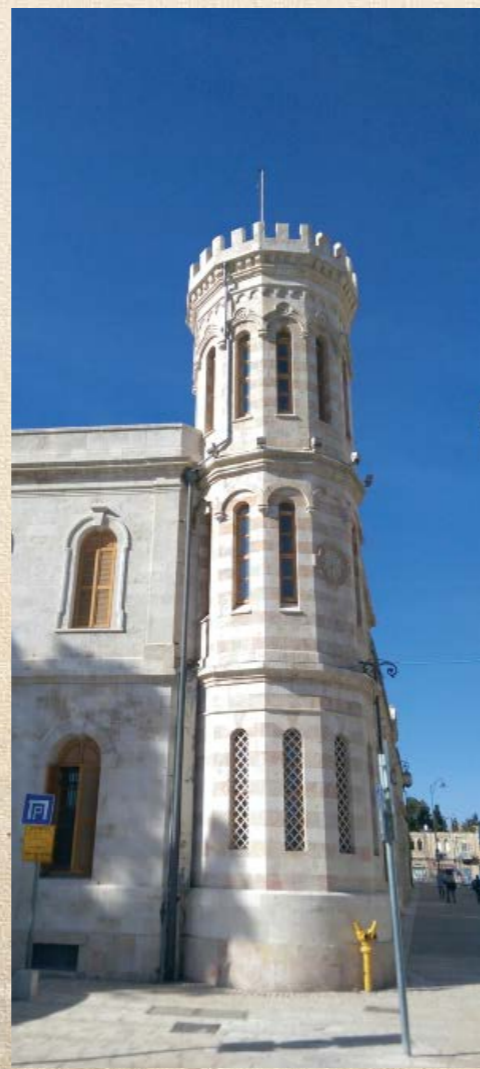
Угловая башня Сергиевского подворья в Иерусалиме. Современный вид