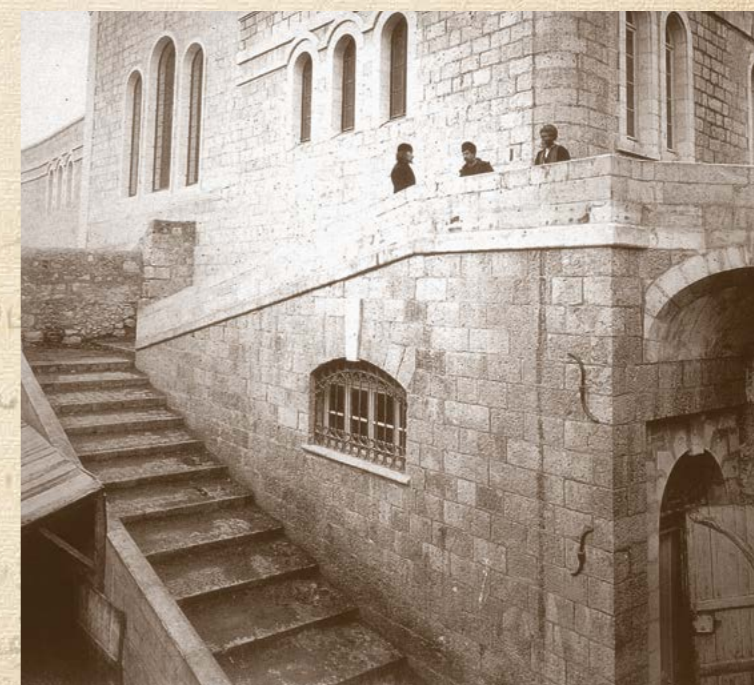
Фасад церкви на Александровском подворье в Иерусалиме. Фото начала XX века