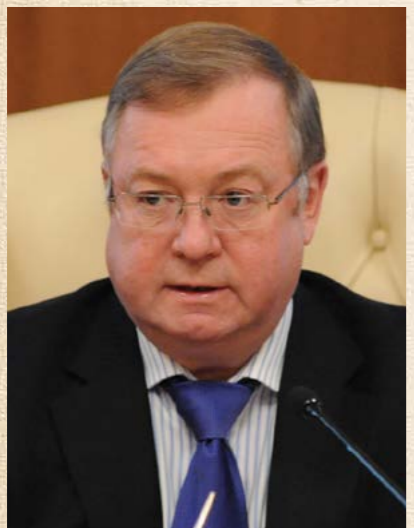
Сергей Степашин , ныне действующий Председатель Императорского Православного Палестинского Общества