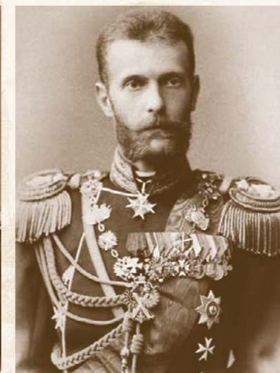
Великий князь Сергей Александрович Романов, первый Председатель Императорского Православного Палестинского Общества, 1889-1905 гг