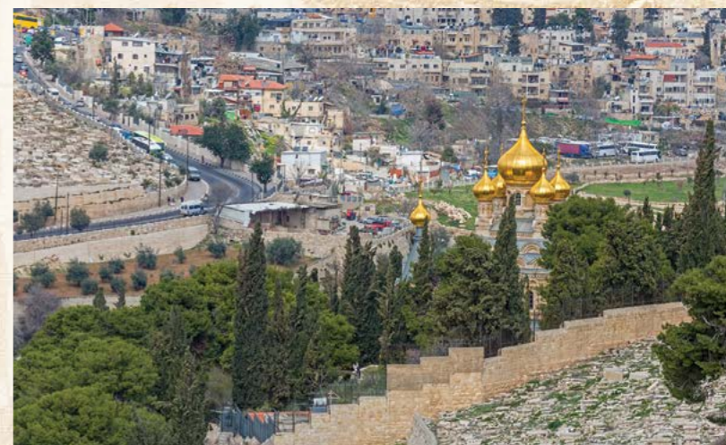
Храм Святой равноапостольной Марии Магдалины, построенный в Иерусалиме на средства императорской семьи Романовых

Поскольку по турецкому законодательству (отсутствие права земельной собственности у юридических лиц – учреждений и обществ) Палестинское Общество не могло иметь на Востоке собственной юридически оформленной недвижимости, треть участков была закреплена за русским правительством, остальные оформлялись как частная собственность. Со временем планировалось добиться у Османского правительства правильного закрепления недвижимостей Общества, но помешали Первая мировая война и революция, которые прервали на взлёте русскую гуманитарную деятельность на Ближнем Востоке.