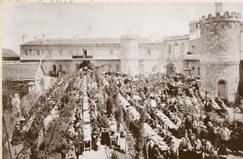
Пасхальное разговение во дворе Сергиевского подворья Императорского Православного Палестинского Общества в Иерусалиме. Конец XIX века