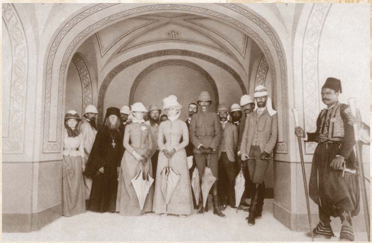
Великие князья Сергей Александрович, Павел Александрович и Великая княгиня Елизавета Фёдоровна во время паломничества в Иерусалим в 1888 году.