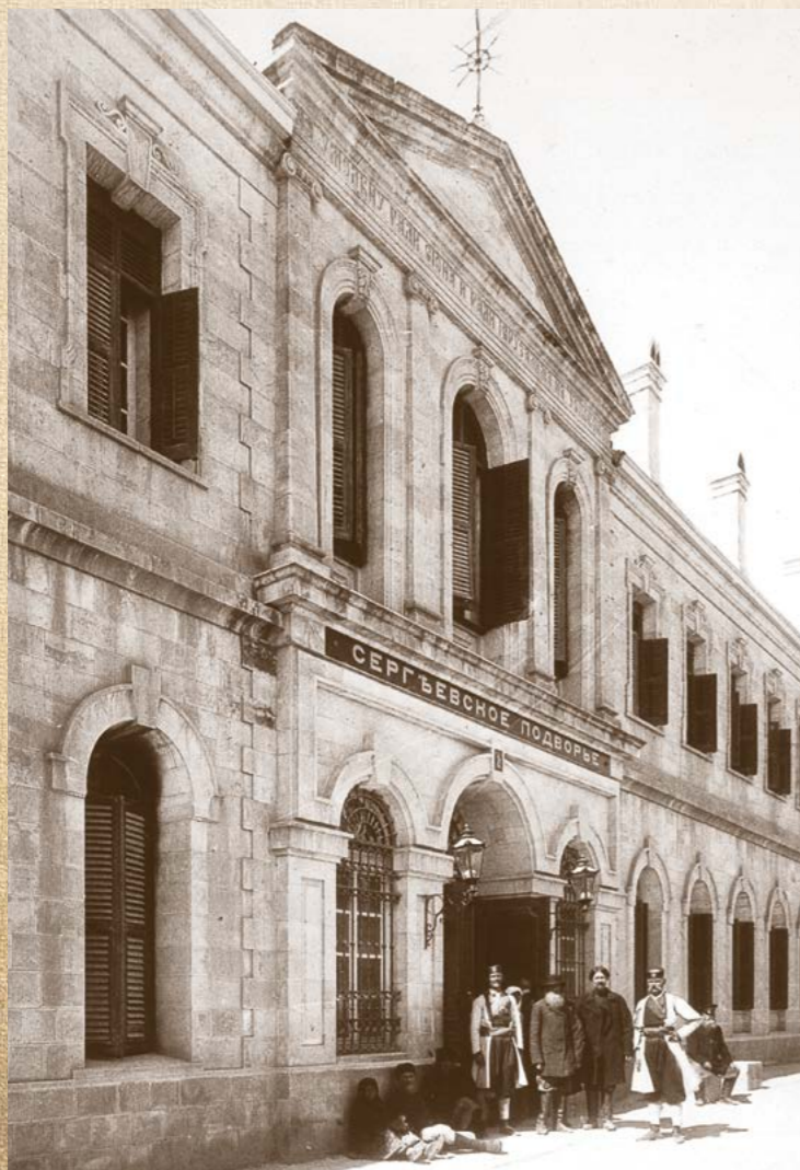
Паломники у парадного входа в Сергиевское подворье. Фото: начала XX века

Носящее имя основателя и первого Председателя Палестинского Общества, Великого князя Сергея Александровича, подворье вместило в свою историю судьбу не только построившего его Общества и всего многогранного русского наследия в Святой Земле, но и императорской России.