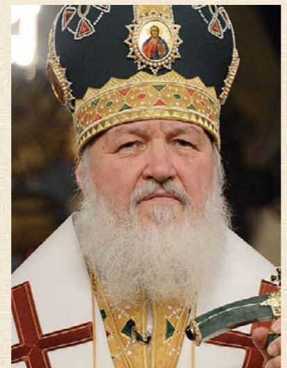
Кирилл, Патриарх Московский и всяя Руси, Председатель Комитета Почётных членов Императорского Православного Палестинского Общества