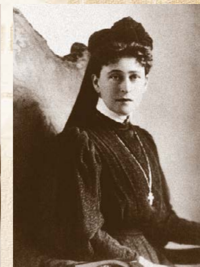
Великая княгиня Елизавета Фёдоровна Романова, второй Председатель Императорского Православного Палестинского Общества, 1905-1917 гг