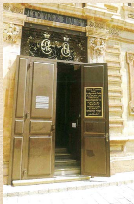
Парадный вход в Александровское подворье в Иерусалиме. Современный вид

Благодаря совместной работе с муниципалитетами Иерусалима, Назарета, Хайфы налажен постоянный контакт и настоящая рабочая атмосфера, которая содействует дальнейшему развитию отношений между Россией и Израилем.