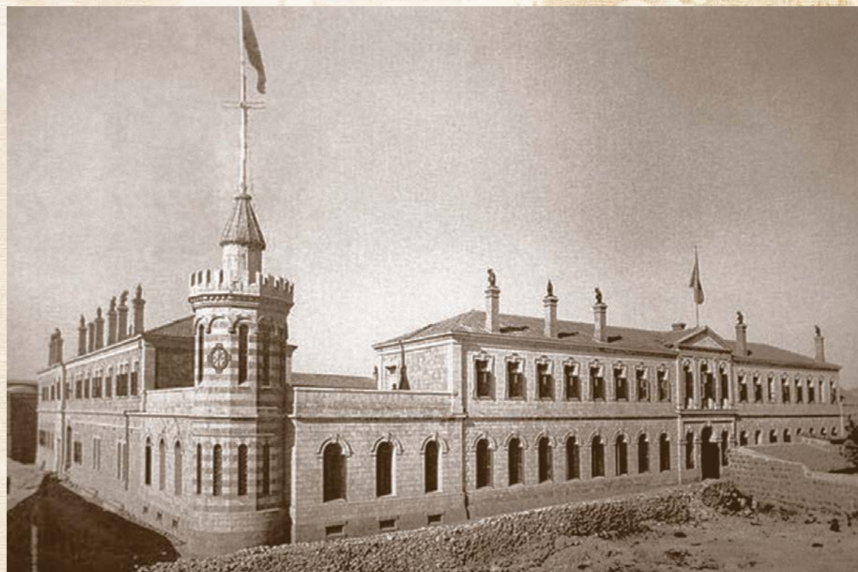
Сергиевское подворье в Иерусалиме с флагом ИППО в 1889 году.

В декабре 2008 г. состоялся исторический акт подписания документа о возвращении России Сергиевского подворья в Иерусалиме – крупнейшего из объектов российской недвижимости в государстве Израиль. В настоящее время завершена его реконструкция. Торжественное открытие – 18 июля 2017 года, в день памяти Сергея Радонежского. Подворье призвано служить тем же целям, что и во времена Сергея Александровича. Здесь готовится открытие паломнического центра, гостиницы, трапезной, музея, залов для экспозиций, а также расположится уникальный архив, который удалось собрать буквально по крупицам, и многое другое.