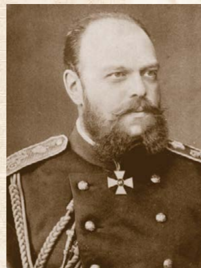
Российский Император Александр III, утвердивший Устав Православного Палестинского Общества 3 июня 1882 года