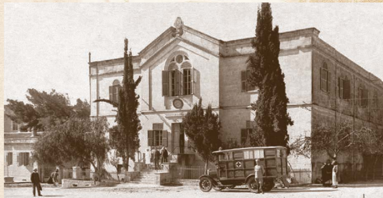
Русская больница в центре западного Иерусалима, построенная в период создания комплекса Русских построек на Мейдамской площади усилиями Палестинского комитета с 1859 по 1864 гг.