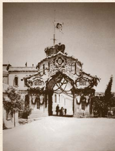
Флаг ИРПО и праздничный вазель Императору Николаю II в 25-летие юбилея ИРПО в Иерусалиме в 1907 году. 1907 г.

Успешными строительными и научно-археологическими проектами Общество быстро смогло завоевать общественное и государственное признание. Высочайшим Указом от 24 марта 1889 г. ему были переданы все полномочия, имущество и капиталы, связанные с русским присутствием в Святой Земле, и оно получило почётное именование Императорского Православного Палестинского Общества.